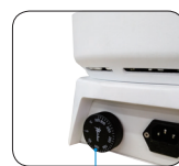
独立限温报警系统